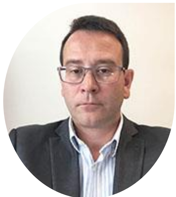
Lionel JOUVE Wirecard